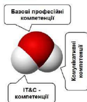
Рис. 1. Базис професійних компетенцій менеджера

На думку В. Приймак, сучасний менеджер має володіти достатнім професійним інструментарієм у конкретній предметній області (базові професійні компетенції), спеціальними професійними компетенціями у сфері інформаційних технологій і систем (IT&C) та відповідним рівнем комунікаційних компетенцій (компетенцій ділового спілкування та міжособистісних взаємовідносин, лінгвістичних та соціальних компетенцій тощо (рис.1) [7].